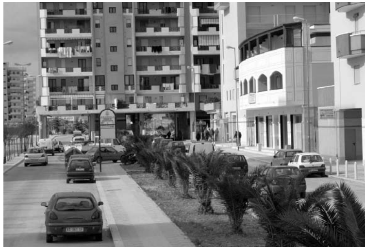
La zona 167

Nel corso della conferenza l'Atc «Uguaglianza» ha rinnovato l'invito al dialogo sulla proposta, formulata in precedenza, di assegnare a tutte le cooperative partecipanti al bando una tranche