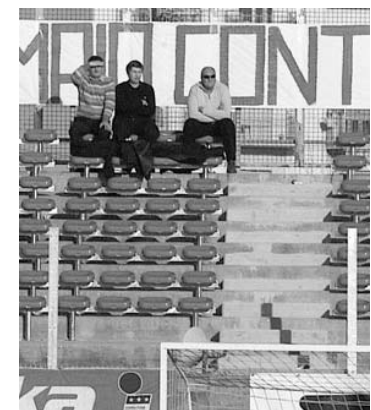
Domani il «debutto» della gradinata rinnovata